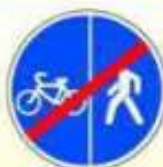
4.5.6. «Конец пешеходной и велосипедной дорожки с разделением движения (конец велосипедной дорожки с разделением движения)»