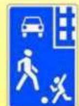
5.21. «Жилая зона»