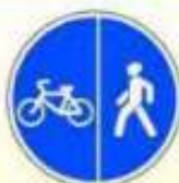
4.5.4. «Пешеходная и велосипедная дорожки с разделением движения»