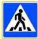
5.19.1. «Пешеходный переход»