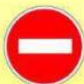
3.1. «Въезд запрещён»