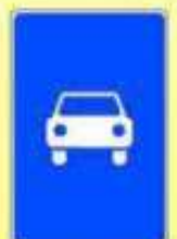
5.3. «Дорога для автомобилей»