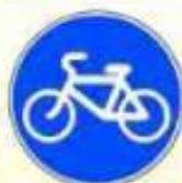
4.4.1. «Велосипедная дорожка»