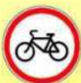
3.9. «Движение на велосипедах запрещено»