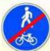
4.5.3. «Конец пешеходной и велосипедной дорожки с совмещённым движением»