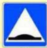
5.20. «Искусственная неровность»