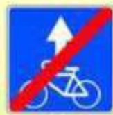
5.14.3. «Конец полосы для велосипедистов»