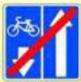
5.12.2. «Конец дороги с полосой для велосипедистов»