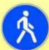
4.5.1. «Пешеходная дорожка»