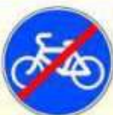
4.4.2. «Конец велосипедной дорожки или полосы для велосипедистов»