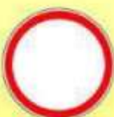
3.2. «Движение запрещено»