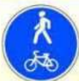
4.5.2. «Пешеходная и велосипедная дорожка с совмещённым движением (велосипедная дорожка с совмещённым движением)»