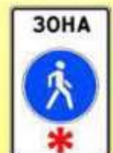
5.33. «Пешеходная зона»