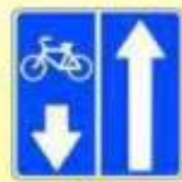
5.11.2. «Дорога с полосой для велосипедистов»