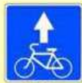
5.14.2. «Полоса для велосипедистов»